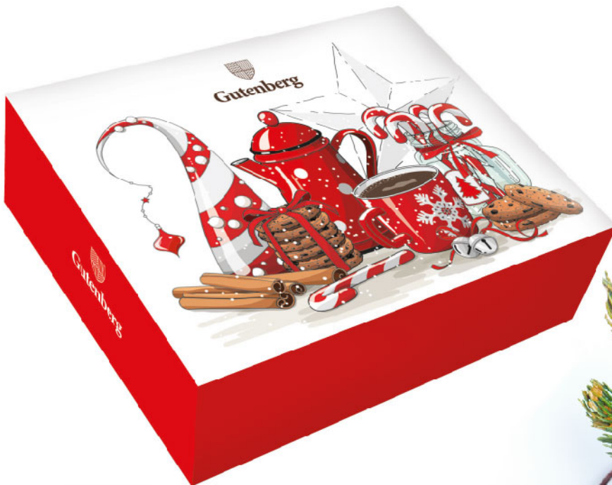
64022_NG-5 Набор подарочных коробок «Сочельник» Размер 20x25x8 см. Материал - картон. В наборе - 5 коробок.