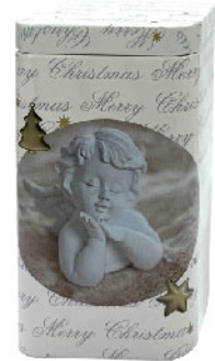
70042 Банка для чая «Рождественский ангел» Объем 50 г