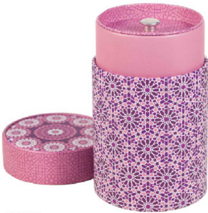
70198 Банка для чая «Андалусия» розовая, круглая Объем 150 г