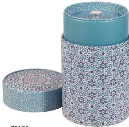
70199 Банка для чая «Андалусия» голубая, круглая Объем 150 г